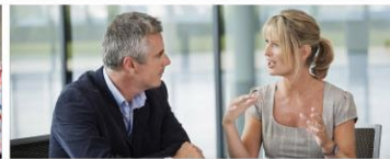
Unternehmen und Services