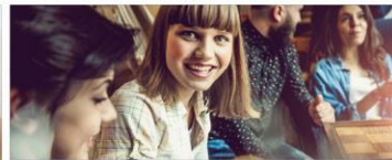
Jugendarbeit und Beruf