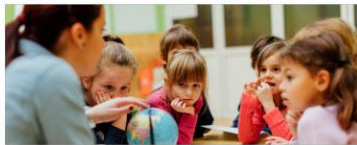
Betreuung an Schulen