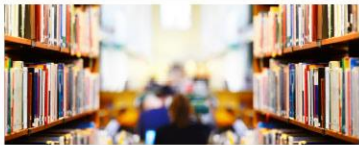
Kultur und Bildung