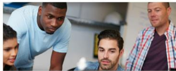
Migration und Integration