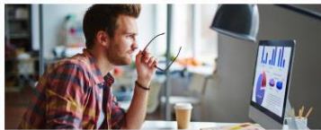
Arbeit und Teilhabe