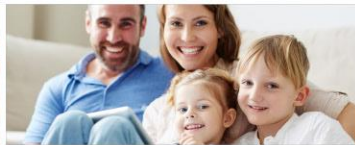
Familie und Erziehung